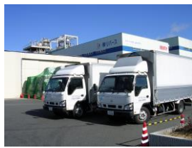
弊社のトラックで社員が、機密書類溶解工場へ持ち込みます