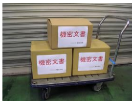
専用FAX用紙でご依頼下さい。1箱からお伺い。

お引取りさせて頂きました書類箱は、機密性を保ったまま、弊社指定製紙工場にて溶解による 情報廃棄し、トイレトペーパーなどにリサイクル処理いたします。環境に貢献できます。