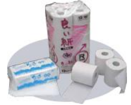
トイレトペーパーなどにリサイクル

廃棄（溶解）処理出来る内容物は、紙類になります。紙ファイル、クリップ、少量のクリアファイルは、そのまま大丈夫です。