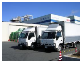
弊社のトラックで社員が、機密書類溶解工場へ持ち込みます