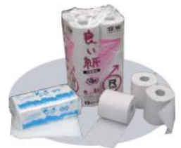
トイレットペーパーなどにリサイクル

廃棄（溶解）処理出来る内容物は、紙類になります。紙ファイル、クリップ、少量のクリアファイルは、そのまま大丈夫です。