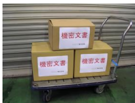
専用FAX用紙でご依頼下さい。1箱からお伺い。

お引取りさせて頂きました書類箱は、機密性を保ったまま、弊社指定製紙工場にて溶解による 情報廃棄し、トイレットペーパーなどにリサイクル処理いたします。シュレッダー処理に比べ、紙繊維 を裁断しない為、リサイクルされ易く環境により貢献できます。