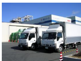
弊社のトラックで社員が、機密書類溶解工場へ持ち込みます