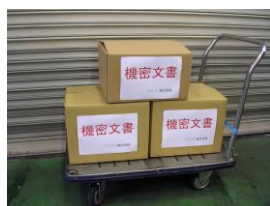
専用FAX用紙でご依頼下さい。1箱からお伺い。

お引取りさせて頂きました書類箱は、機密性を保ったまま、弊社指定製紙工場にて溶解による情報廃棄し、トイレットペーパーなどにリサイクル処理いたします。シュレッダー処理に比べ、紙繊維を裁断しない為、リサイクルされ易く環境により貢献できます。