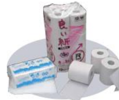
トイレットペーパーなどにリサイクル

廃棄(溶解)処理出来る内容物は、紙類になります。紙ファイル、クリップ、少量のクリアファイルは、そのまま大丈夫です。