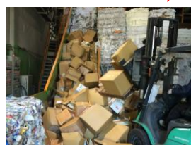
書類箱ごと溶解処理します。社員が見届けますのでご安心下さい